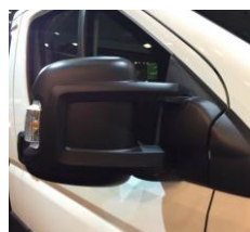
↑ стандартні зовнішні дзеркала.